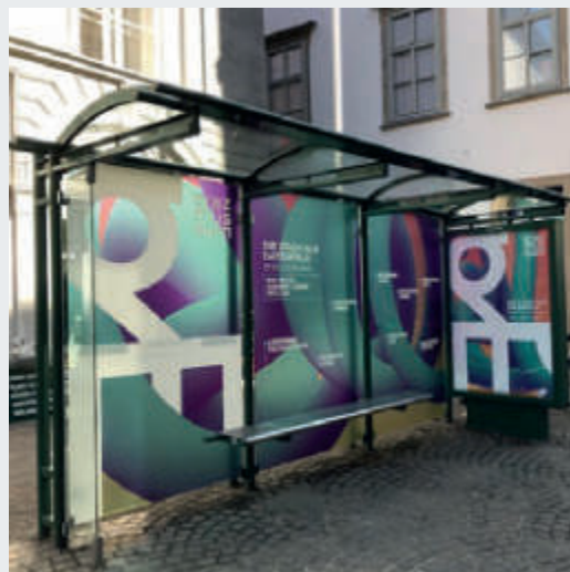
► Totallook Warthaus mit City Light