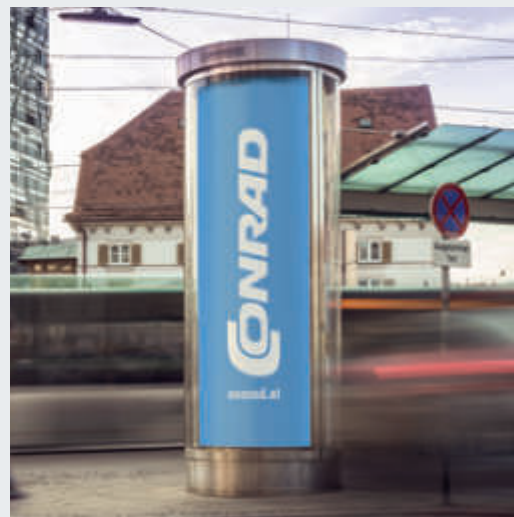
► City Säule